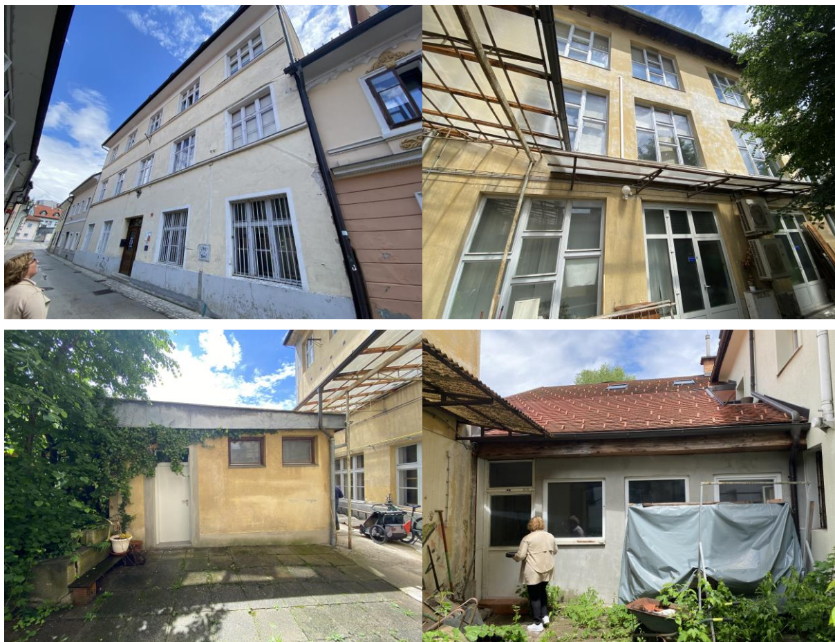
ZVKDS OE Kranj

0.1.1.9 Energetske sanacije je potreben obstoječi objekt ZVKDS, OE Kranj, ki je prikazan na spodnjih fotografijah.